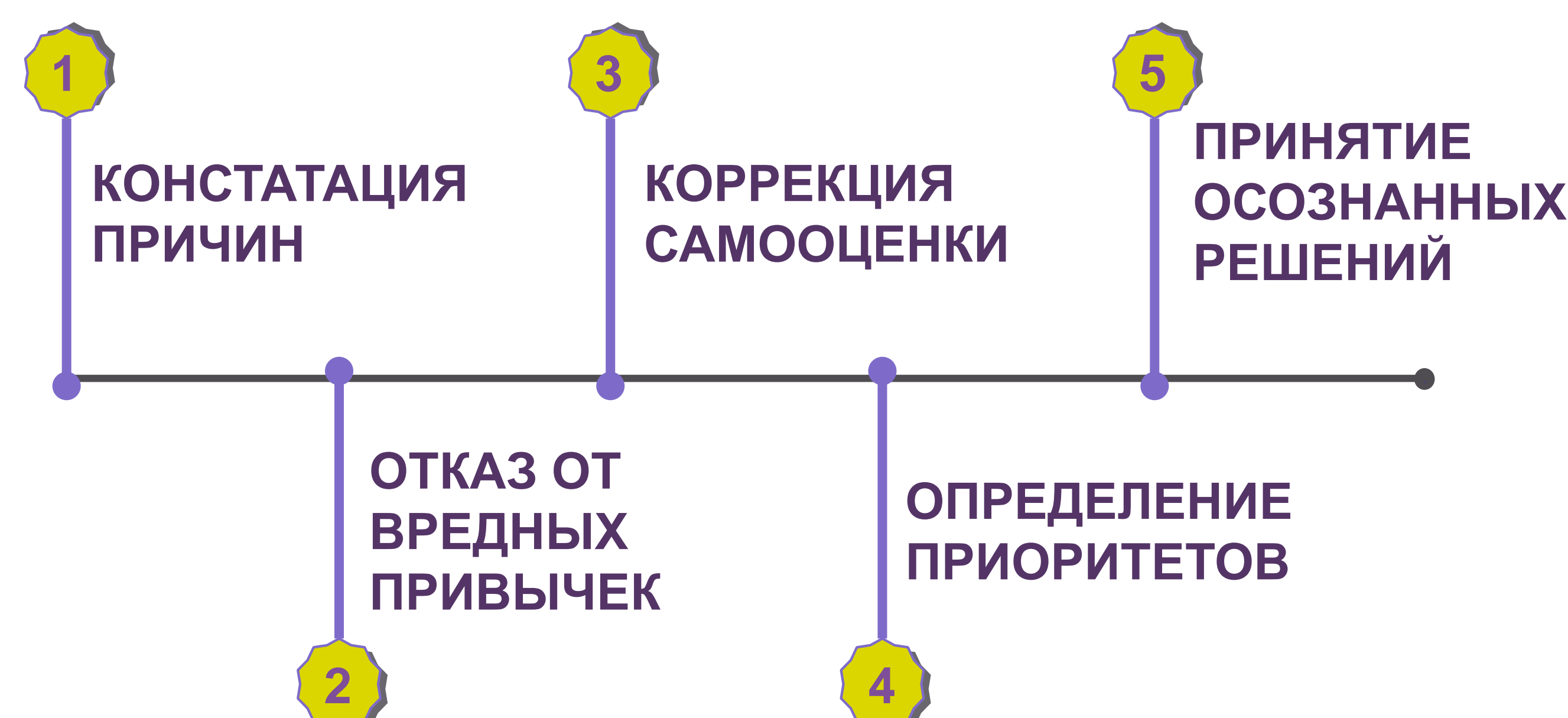
Рис. 3. Направления профилактики тревожности среди молодежи.

Сравнительный анализ выявил высокий уровень тревожности среди студентов-медиков. При этом ЛТ юношей за 11 лет выросла вдвое. Повышенная тревожность среди будущих врачей указывает на уязвимость этой группы в отношении психосоматических и психоэмоциональных патологий и является основанием для реализации профилактических программ (Рис.3).